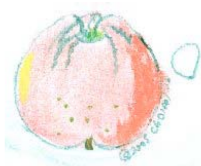
Pastel Choisel jean-louis©2003.

Anjou ou A.Leroy l'y trouva au Comice d'Angers sous le n°162, en 1840. Le docteur Bretonneau de Tours la cultivai sous le synonyme de pomme d'Eve, vers 1852 (il est mort en 1862).